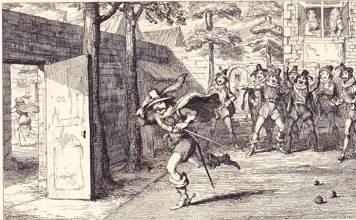
The Citizen and the Soldier.